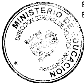
Felipe Pétriz Calvo

EL DIRECTOR GENERAL DE POLÍTICA UNIVERSITARIA