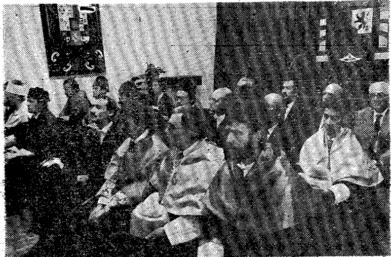
Un aspecto del público asistente al acto.