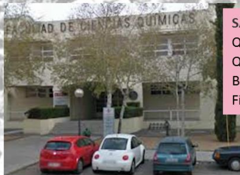
SAN ALBERTO MAGNO Química Analítica Química Orgánica, Inorgánica y Bioquímica Física