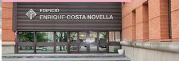
EDIFICIO ENRIQUE COSTA Ingeniería Química