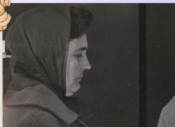
© Fotograma 48 (Susana de Sousa Dias, 2009)

Este artículo analiza tres películas de la directora de cine Susana de Sousa Dias para esclarecer el papel de la imagen fotográfica en el cine de la portuguesa y visibilizar su trabajo.