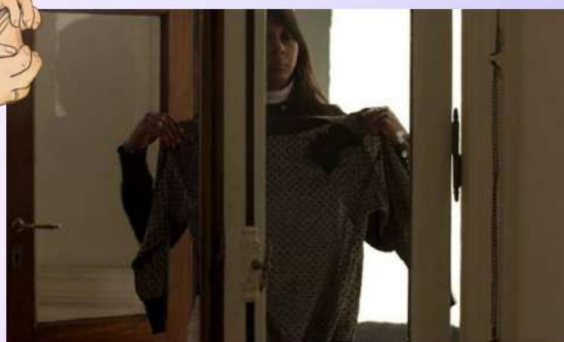
© Fotograma Reimon (Rodrigo Moreno, 2014)

Esta investigación analiza las estrategias audiovisuales que ponen en primer término las tareas domésticas. Aunque con frecuencia permanecen invisibles en las ficciones, han ido ganando importancia en las historias y las imágenes.