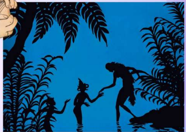
© Fotograma Las aventuras del príncipe Achmed (Lotte Reiniger, 1926)

Trabajo Fin de Máster. Curso 23/24. Máster Universitario en Producción y Comunicación Cultural-UCLM