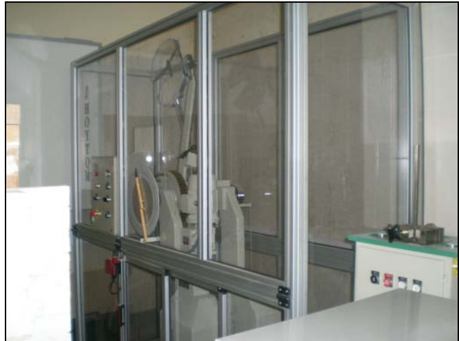
El mismo equipo con protección.

El objeto de la presente nota informativa es establecer unas normas básicas en la adquisición de equipos de trabajo según normativa de aplicación.