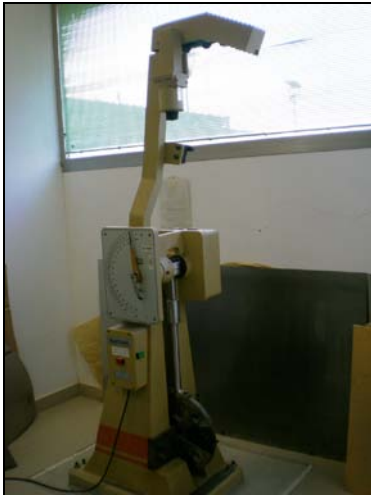
Ejemplo de equipo sin protección