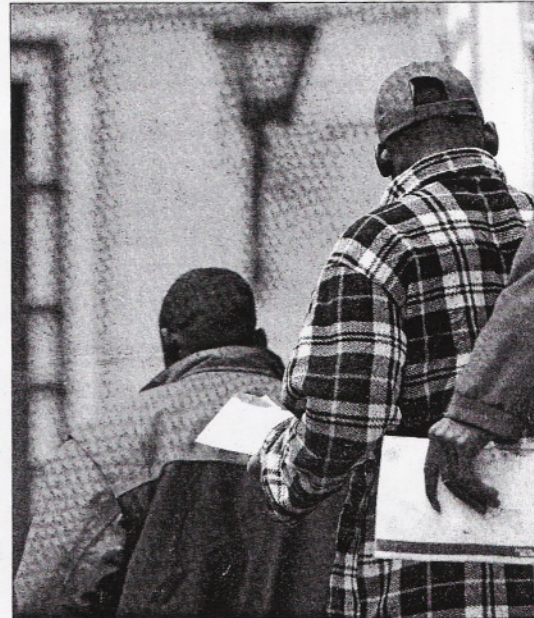
La regularización de inmigrantes ha jugado un papel clave.

Por grandes grupos de edad, podemos hablar de una población ligeramente envejecida en Albacete, con 67.913 habitantes en la provincia de 65 años o más, 252.139 habitantes de 16 a 64 años y 64.588 habitantes menores de 16 años.