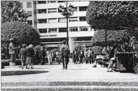
La estadística del INE nos presenta una población levemente envejecida. / LT