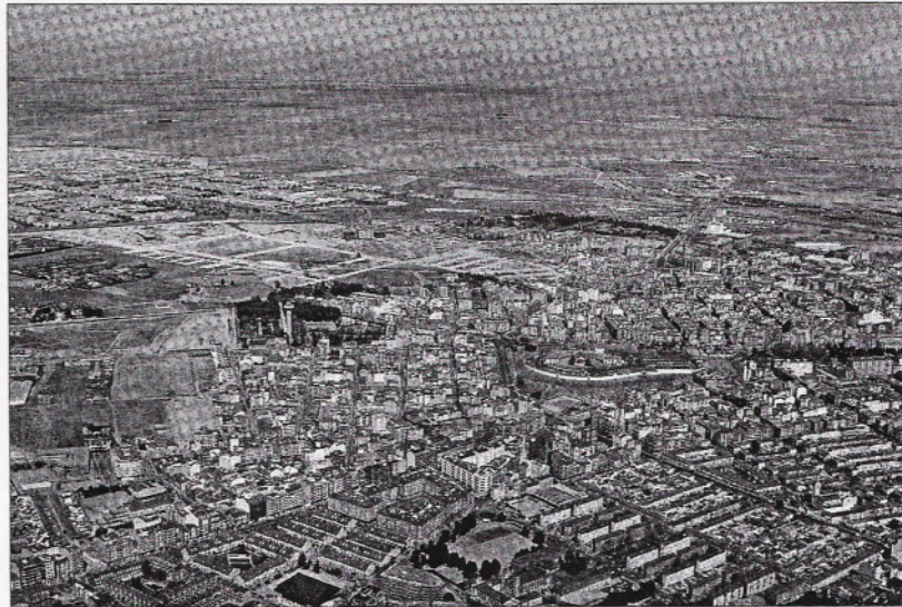
La ciudad de Albacete crece en población y en extensión.

Los varones superan a las mujeres en el número de extranjeros residentes tanto en Albacete capital como en la provincia, puesto que hay casi 3.000 inmigrantes hombres más que mujeres.