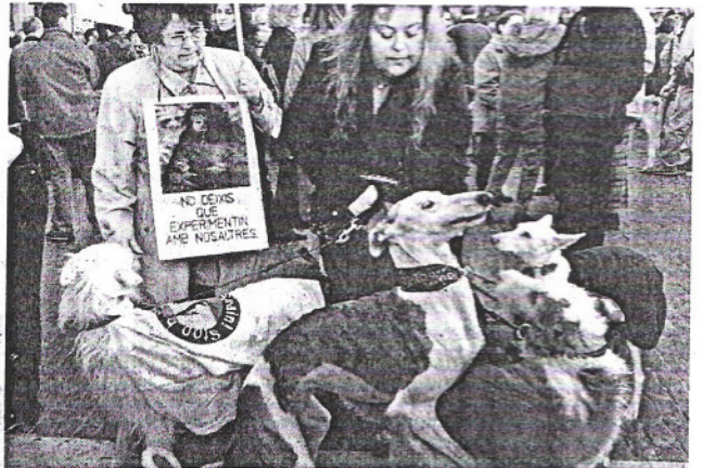
El rechazo a las pruebas con animales ha sido palpable entre la sociedad

El Parlamento Europeo reclamó asimismo la igualdad de trato de todas las religiones y alertó sobre la violencia doméstica y las violaciones en el matrimonio. No obstante, el impacto será limitado porque el informe del Parlamento Europeo no es vinculante.