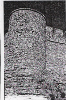
Castillo de Chinchilla.