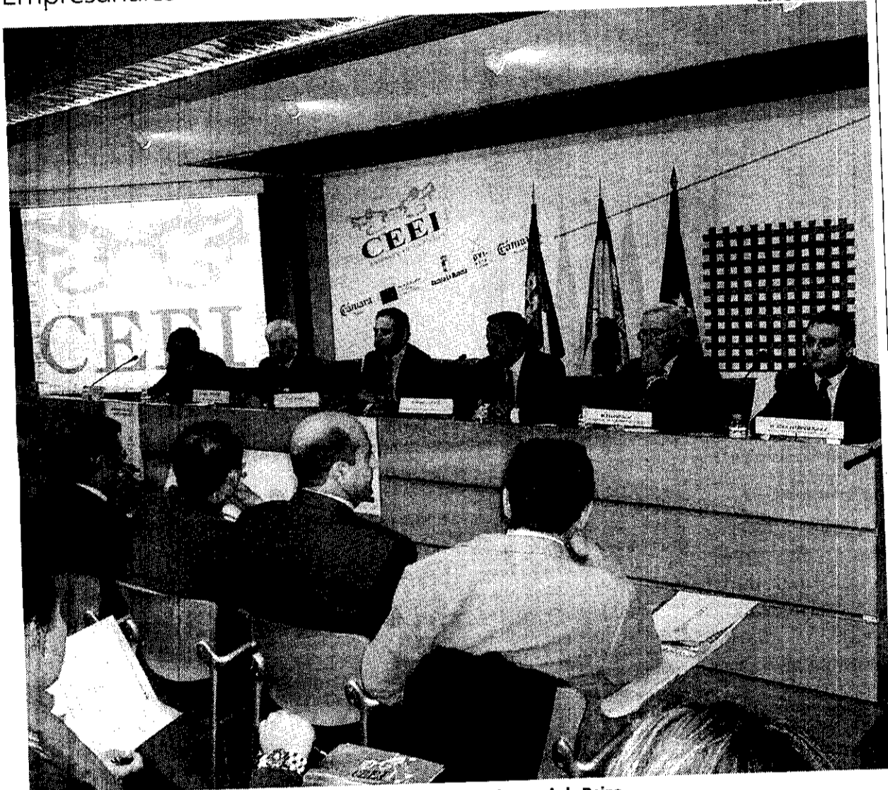
Expertos en la empresa familiar participaron en esta jornada de Talavera de la Reina.

Alrededor de 150 emprendedores y estudiantes de Ciencias Empresariales han conocido las posibilidades de estas empresas