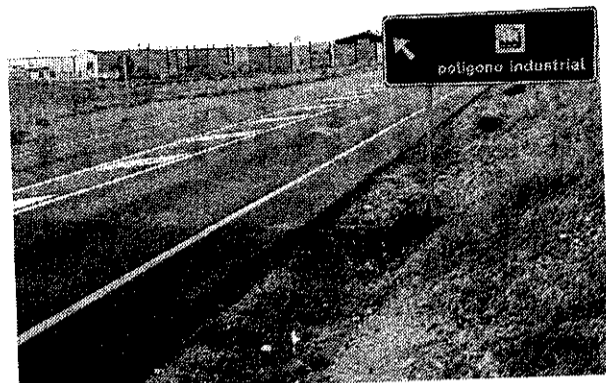
Imagen del polígono de Villamayor de Santiago.