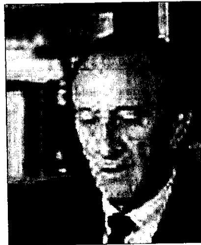
Javier Sáenz de Oiza

abierta hasta el mes de abril, pueden contemplarse diversos croquis, plantas y alzados de obras como el Auditorio de Bilbao, el Centro Cultural en la Alhondiga, también en Bilbao, o el proyecto de las Torres Blancas de Madrid. Los dibujos están realizados en tinta sobre papel vegetal y algunos son de gran tamaño, sobrepasando los dos metros de largo. □