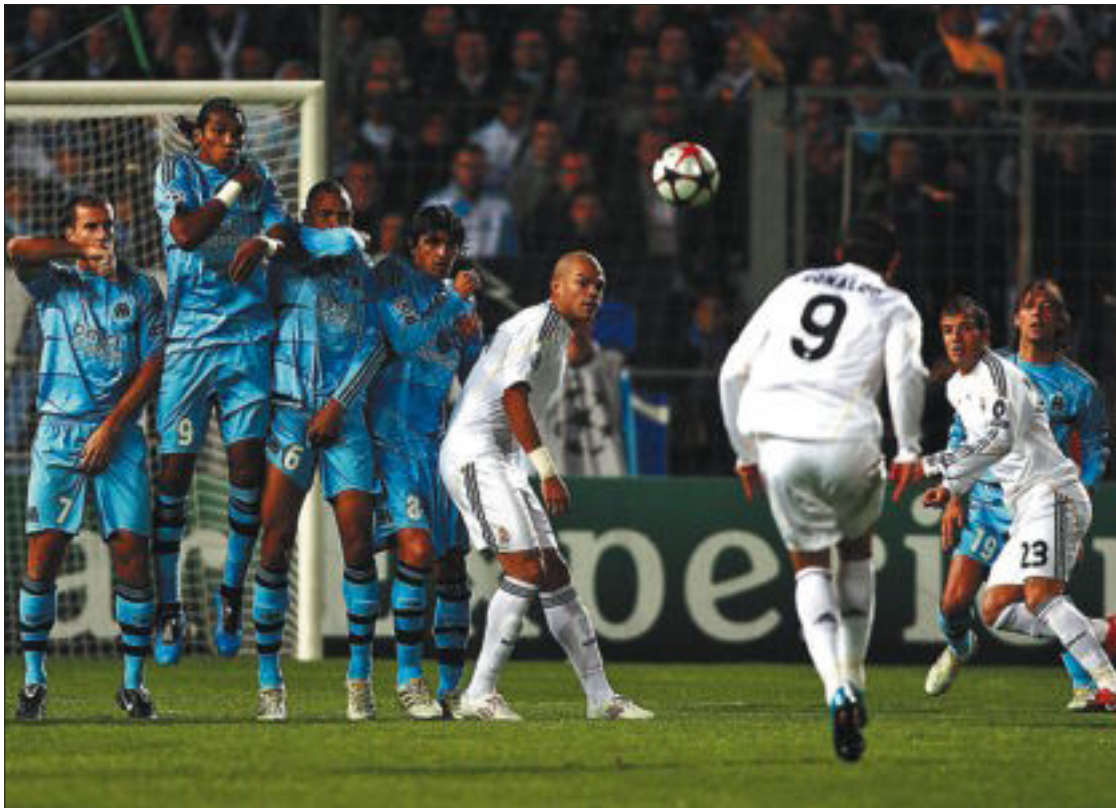
Cristiano Ronaldo marca un gol de falta al Marsella en la Liga de Campeones.

Los estudios realizados en los últimos años han usado la cinemática para obtener información tanto del balón como del chut. Del balón se han analizado las trayectorias, velocidades y número de vueltas por unidad de tiempo. Por otro lado, se han reproducido las condiciones en túneles de viento, en los que se han calculado los coeficientes aerodinámico (CX) y de sustentación de los balones ante diferentes regímenes de circu-