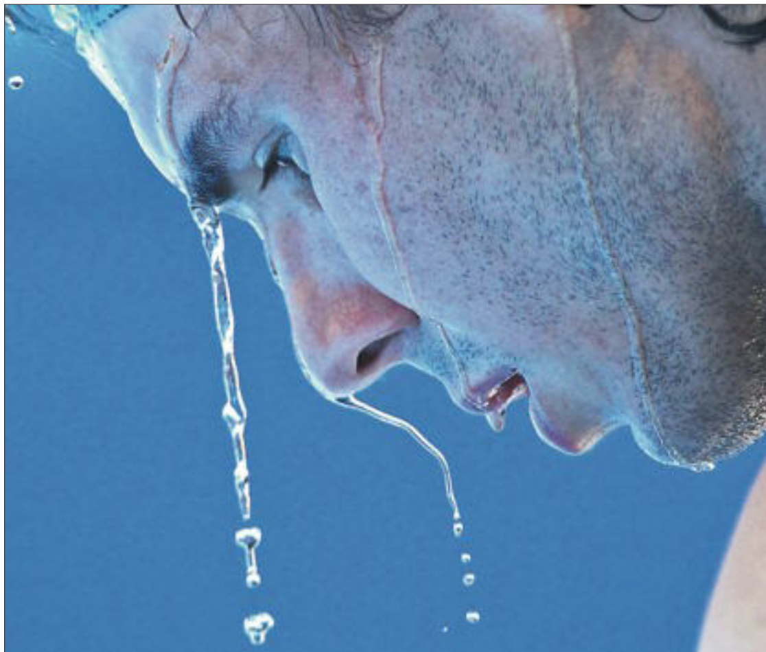
Rafael Nadal, en uno de los descansos de su partido ante Feliciano López.

Berdych pondrá a prueba la capacidad de Nadal para utilizar su brazo como palanca: tanta fuerza le permite esperar atrás a que la pelota cierre su trayectoria. El checo es el jugador que ha disparado más aces de los que sobreviven en el tor-