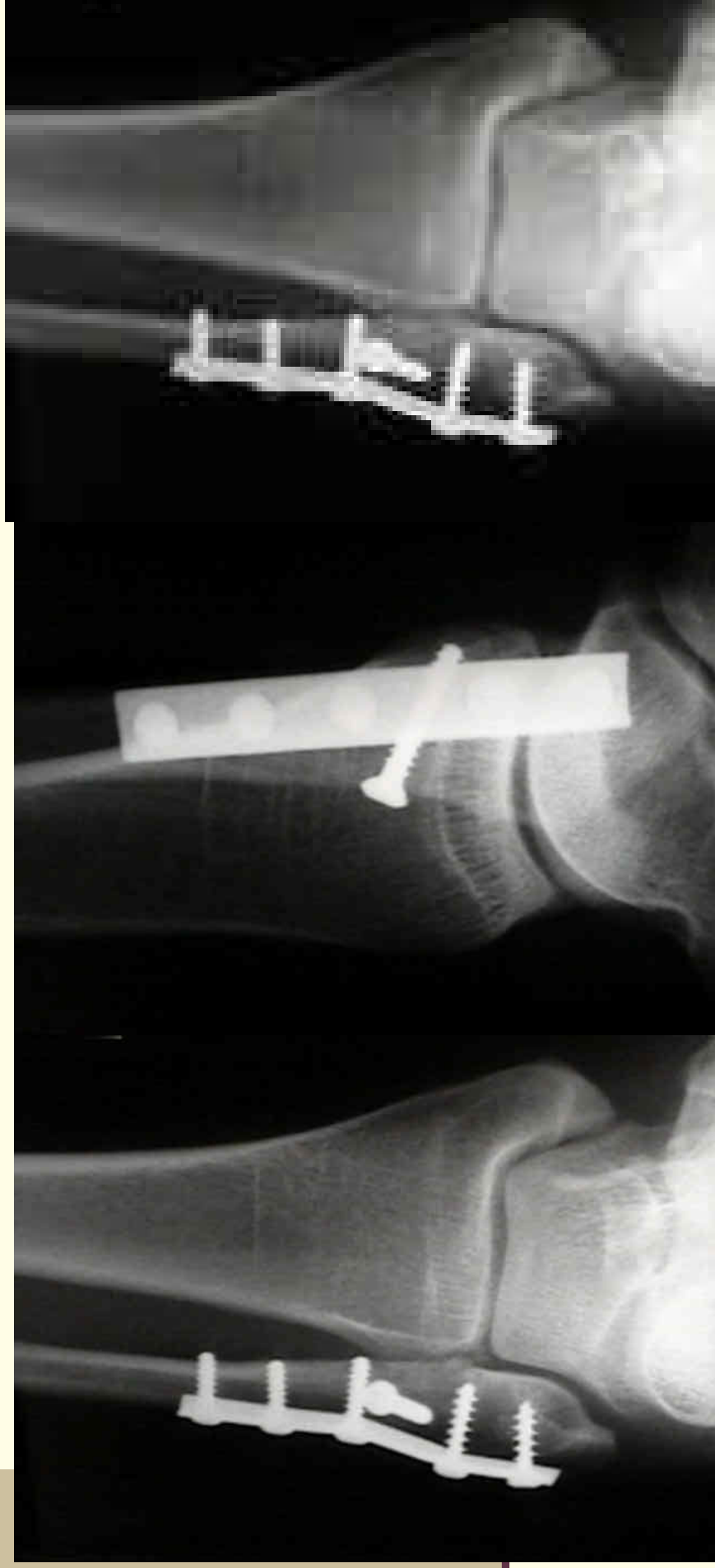
Fractura de maleolo