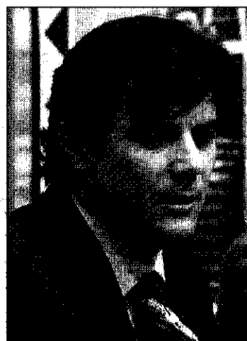
Francisco Javier Cantero, politólogo.

La conferencia inaugural del amplio programa de sesiones corrió a cargo del diplomático Francisco Javier Cantero, jefe de área de la Alianza de Civilizaciones. Su ponencia comenzó con una exposición de los factores que jugaron a favor de la creación de esta iniciativa internacional en 2004, una explicación de sus políticas en España y un recorrido por algunos de sus proyectos de mayor interés. Según Cantero, «la Alianza de Civilizaciones es una realidad que en muchas ocasiones se ha considerado etérea, politizada y vacía de contenidos», nacida en un momento en el que Naciones Unidas «no contaba con herramientas específicamente dedicadas a fomentar el diálogo entre civilizaciones». Pocos gobiernos y organismos internacionales se