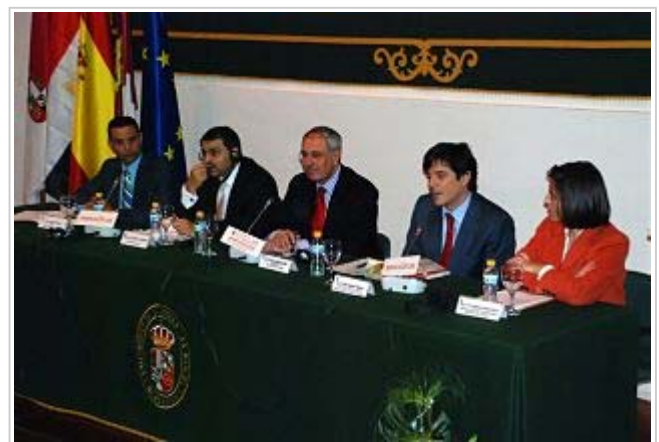
El rector y el embajador de Egipto inauguraron las jornadas.