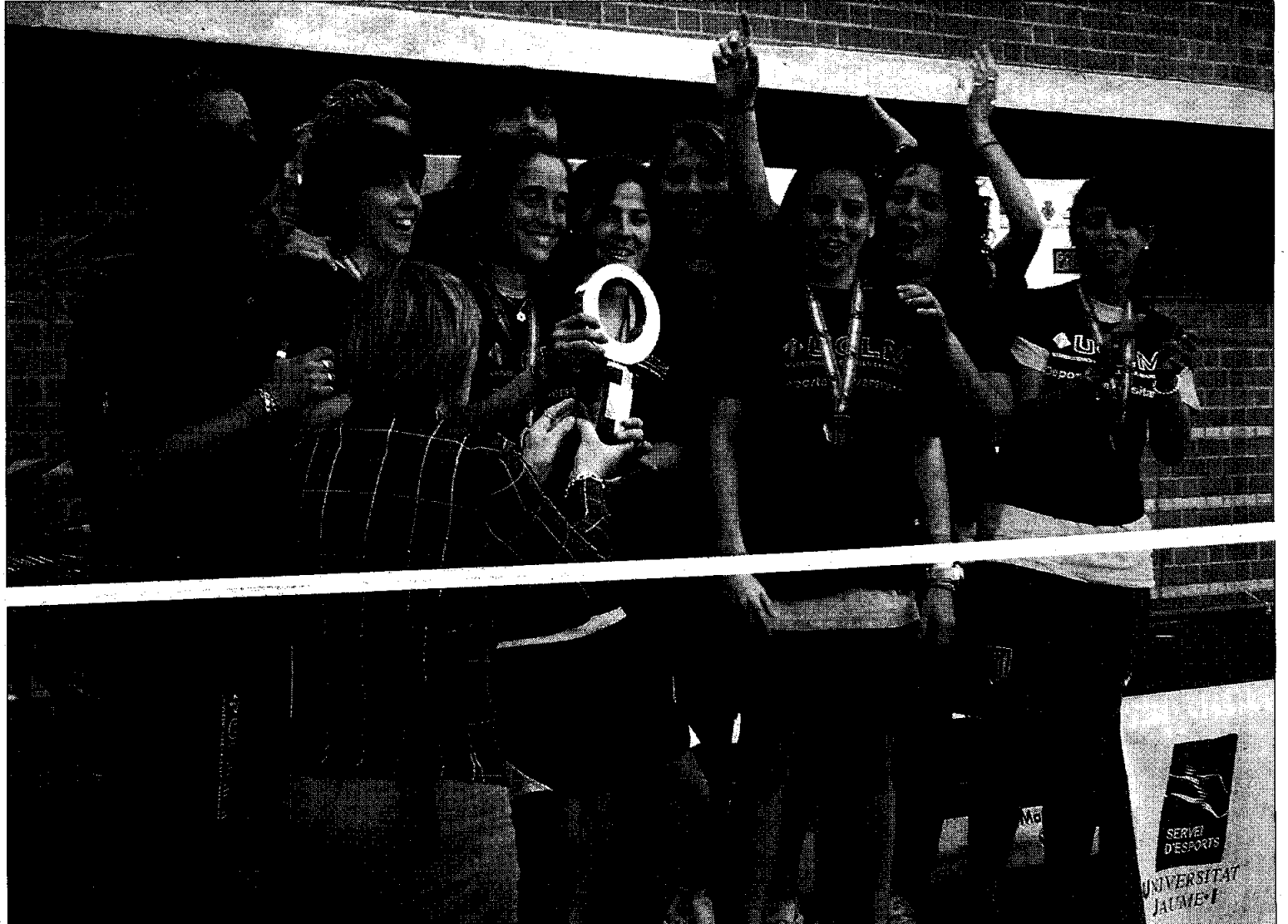
Equipo de fútbol 7 femenino de la UCLM que logró la medalla de bronce en los pasados Campeonatos de España.

En el transcurso de la Gala se reconocerá la labor de los depor-