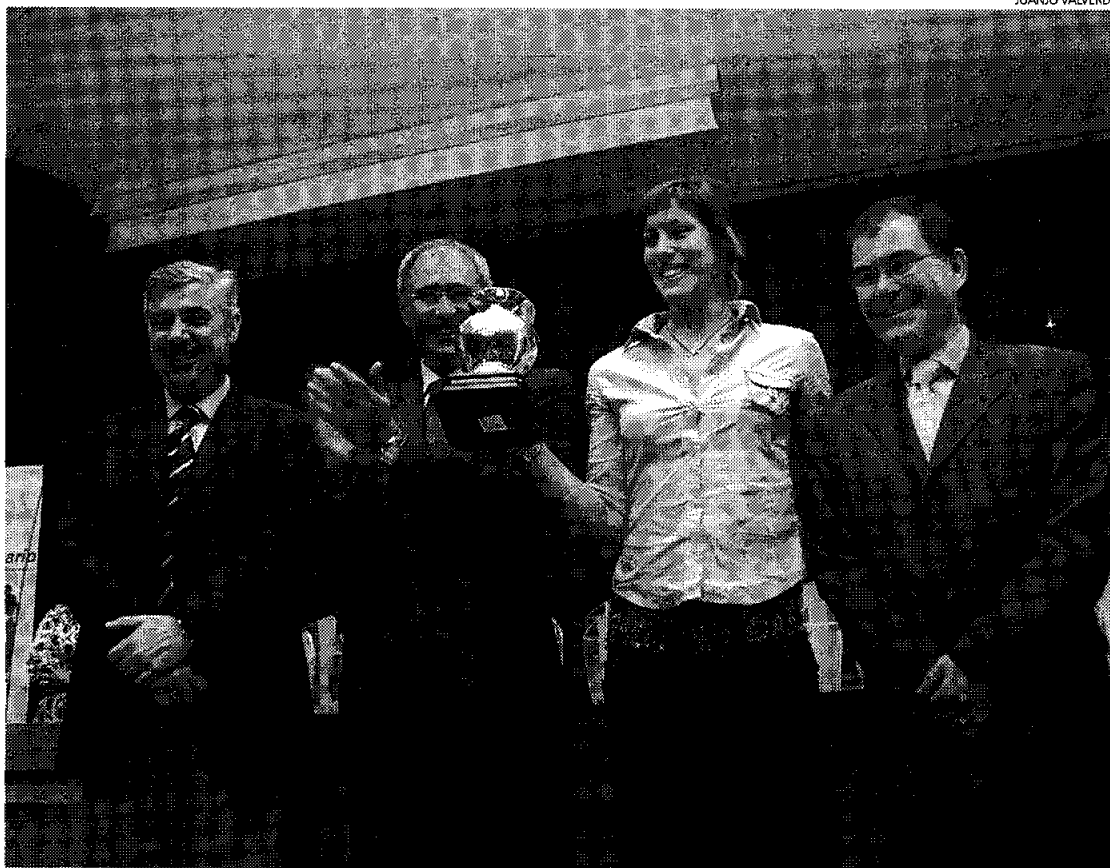
La III Gala del Deporte Universitario premió el trabajo de los deportistas universitarios.

En este sentido, el rector tuvo palabras de reconocimiento para todos los galardonados, especialmente para los 88 deportistas que representaron a la UCLM a nivel