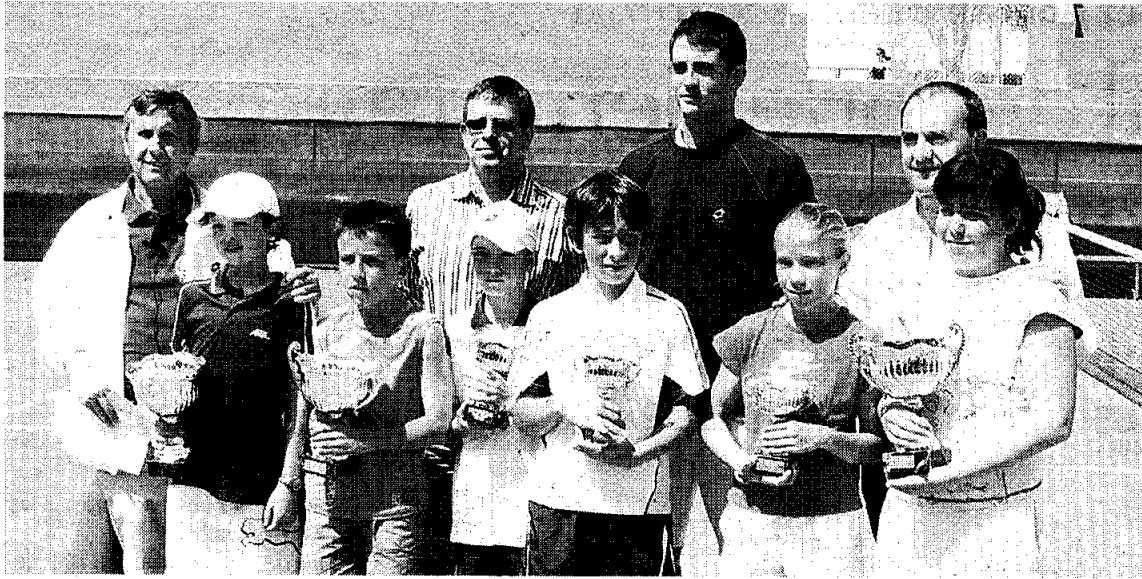
Los mejores alevines posan junto a su ídolo Guillermo García López.