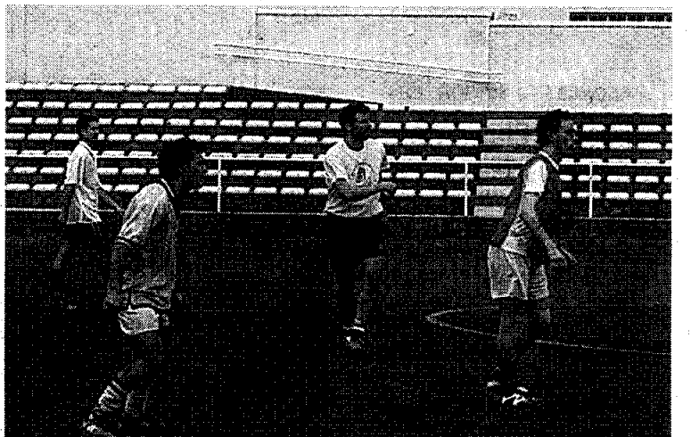
Imagen de un partido de un grupo de deportistas universitarios.

De momento, ésta será la primera cita, para posteriormente continuar con algunas otras jornadas, hasta que los seleccionadores tengan a punto los equipos correspondientes, disputando una liga a una vuelta.