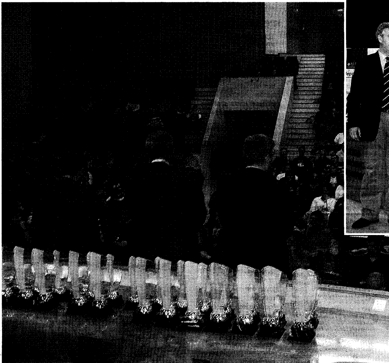
ABARROTADA. Imagen que presentaba el Aula Magna de Económicas y Empresariales durante la Gala.

En el momento actual la participación y uso de este servicio, lejos de disminuir se incremen-