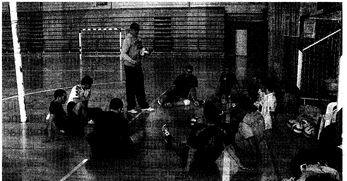
EN CORRO. Los jugadores de fútbol sala escuchan atentamente al seleccionador.