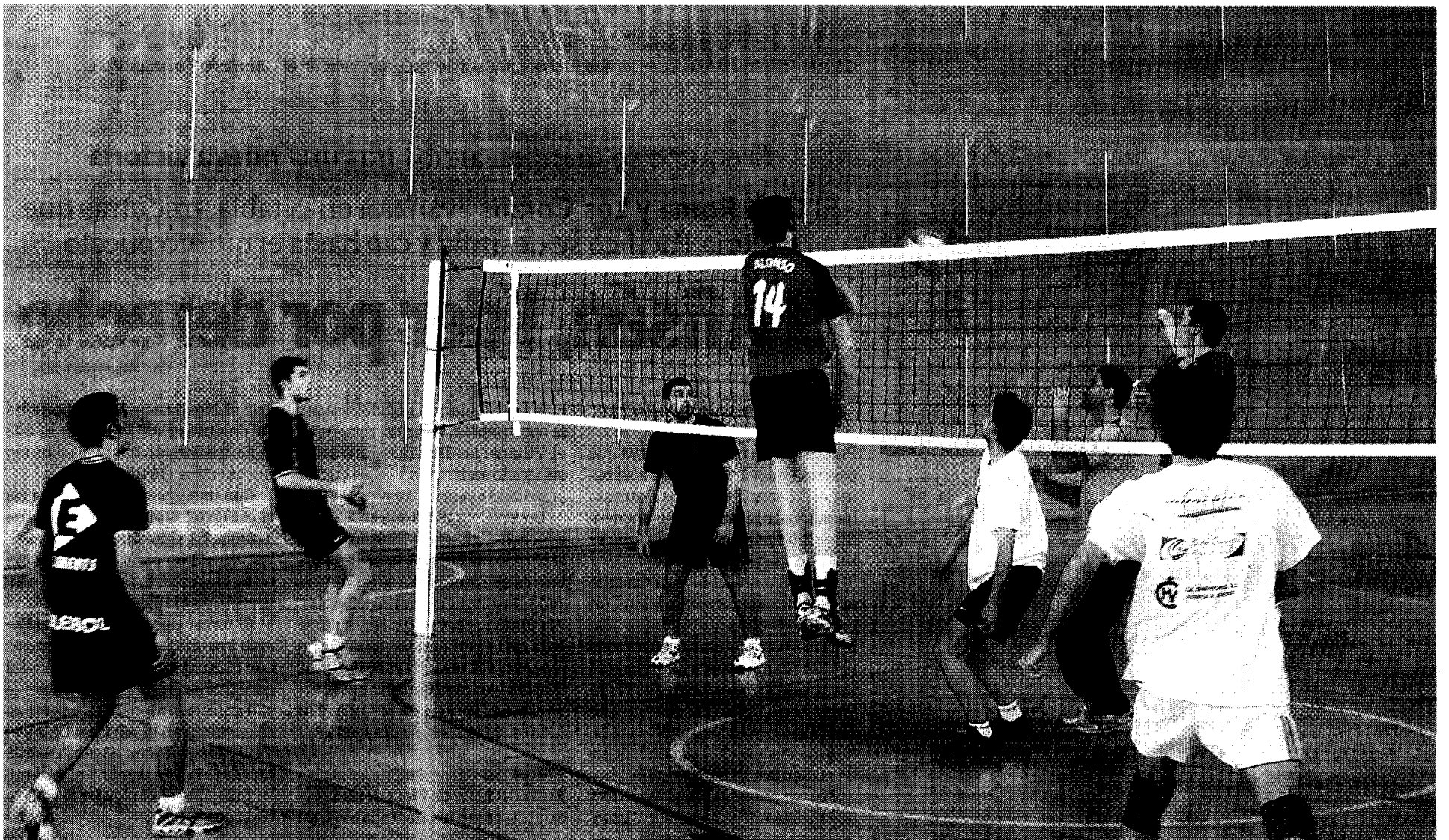
LOS MEJORES. Los mejores jugadores de la Universidad de Castilla-La Mancha, se reunieron el pasado lunes en el campus albaceteño, para las pruebas de la selección.

Los seleccionadores de la UCLM comienzan a confeccionar sus equipos Voleibol, fútbol sala y fútbol realizaron las primeras pruebas el pasado lunes