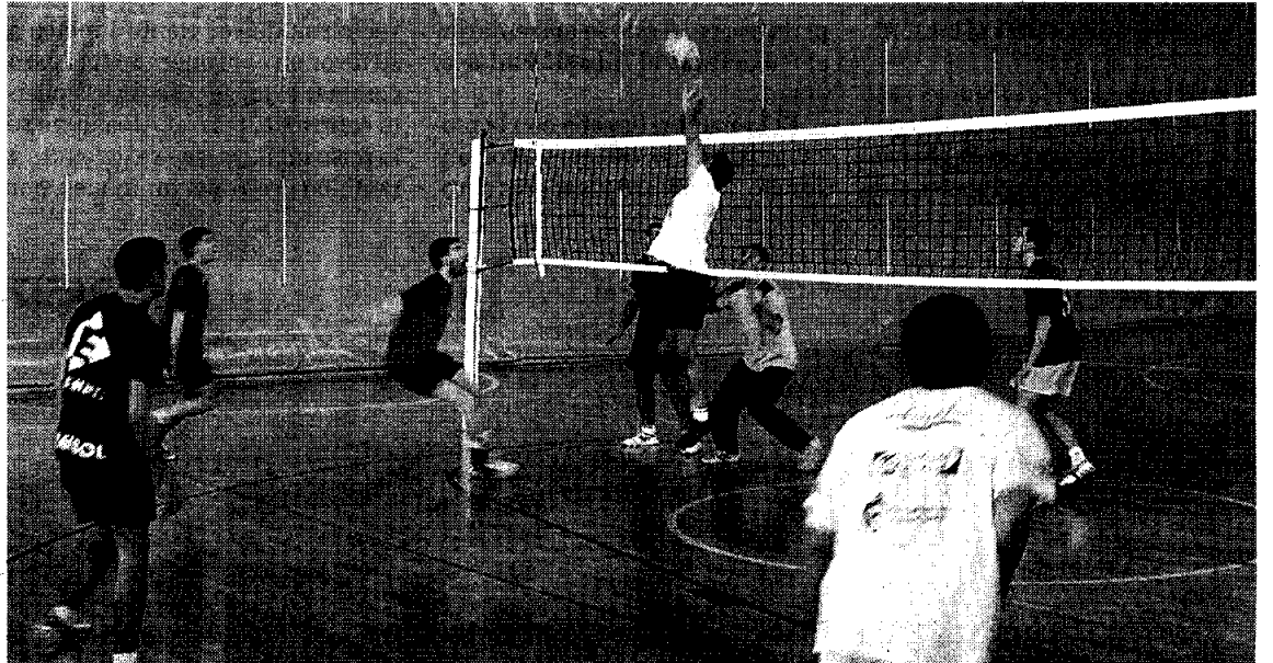
ENTRENANDO. Los jugadores de la futura selección de voleibol durante el entrenamiento.

Las fases previas de la competición comenzarán a jugarse en el mes de abril, aunque la fecha aún no es definitiva, como ocurre con la fecha de los Campeonatos de España, que previsiblemente se disputarán en mayo.