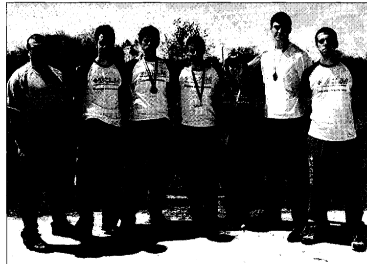
Representantes de la Universidad de Castilla-La Mancha, en el Nacional.

Pero además es reflejo de la buena relación que existe entre la Federación de Castilla-La Mancha y la Universidad regional. Una colaboración que ha