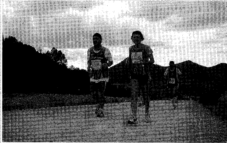
CAMPO A TRAVÉS. Imagen de archivo de una competición.