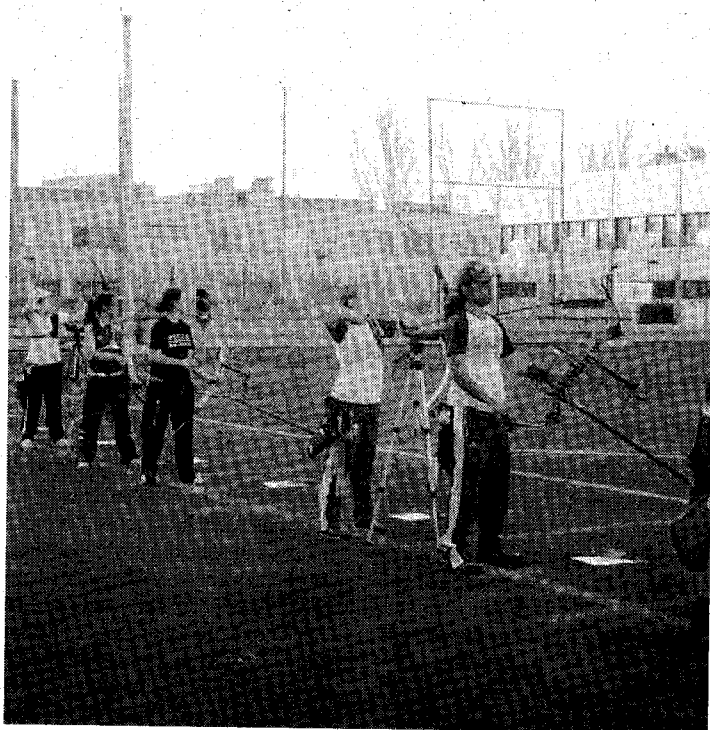
ARCO. Imagen de las pruebas de arco del pasado año.

Los últimos clasificados, que han notado mucho su baja asistencia al senderismo, son Gente de flais con 26 puntos y Chiquete ya no mete con 24.