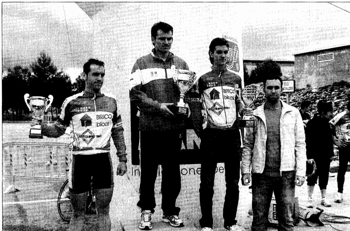
Imagen del podio masculino.