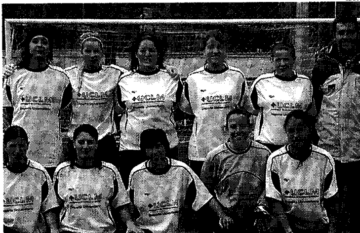
Plantilla y entrenador del Universidad de Castilla-La Mancha.

En el otro grupo, el B, los cuatro equipos que han logrado clasificarse son los de las universidades de Valencia, Granada, Barcelona y Salamanca.