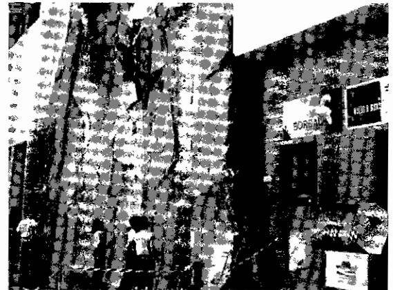
ESCALADA. Los universitarios se ponen en forma.