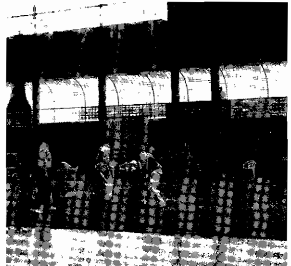
TAEKWONDO. Deporte muy completo para el mantenimiento.