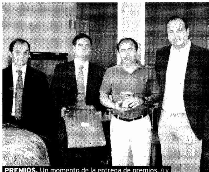
PREMIOS. Un momento de la entrega de premios.