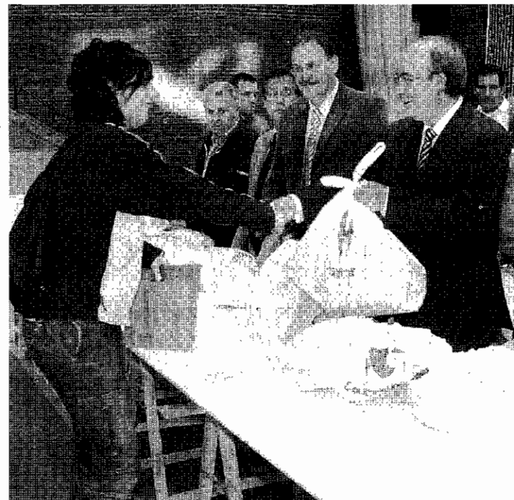
ENTREGA. El alcalde entregando unos balones.

Los Juegos Deportivos Municipales están ya en su recta final y quedan tres jornadas en la mayoría de modalidades y categorías para que concluya la competición que comenzó en octubre y que suele finalizar siempre con el mes de mayo. En junio se ha celebrado otros años la entrega de trofeos de estos Juegos Deportivos. Son muchos los jóvenes y