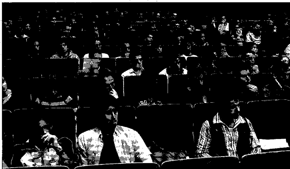
Los deportistas universitarios premiados acudieron a la gala.

Estos terrenos fueron cedidos por el Ayuntamiento de Cuenca a la UCLM para su uso por una duración de 25 años, tras la aprobación correspondiente en Pleno municipal el pasado mes de junio. Con ello, éste será el primer campo de fútbol 7 de césped artificial