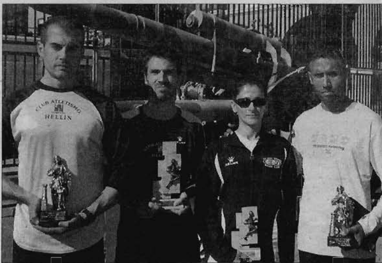
La representación de Hellín rayó a buen nivel en Cartagena