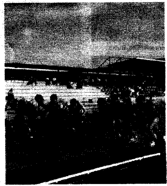
TROFEO RECTOR DE ATLETISMO. Congregó a los mejores atletas universitarios de la zona de Levante.